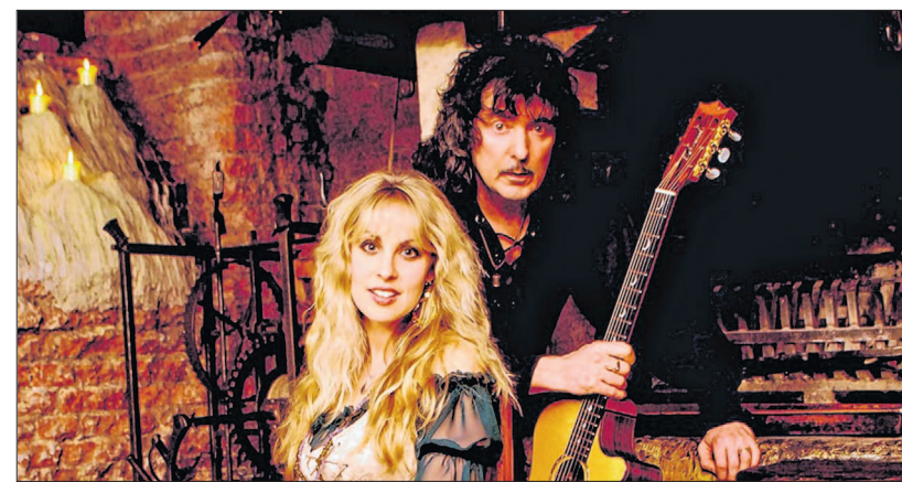
Ein Traumduo mit Langzeitwirkung: Candice Night und Ritchie Blackmore.

Blackmore: Ich kann mich auf keinem Instrument besser ausdrücken. Ich übe praktisch pausenlos. Als ich sieben Jahre alt war, brachte ein Freund eine Gitarre mit zur Schule. Ich war überwältigt von der Schönheit und dem Klang. Diese Liebesaffäre dauert bis heute an. Interview: Olaf Neumann